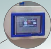
цифровое или аналоговое управление машиной цифровое или аналоговое управление машиной цифровое или аналоговое управление машиной